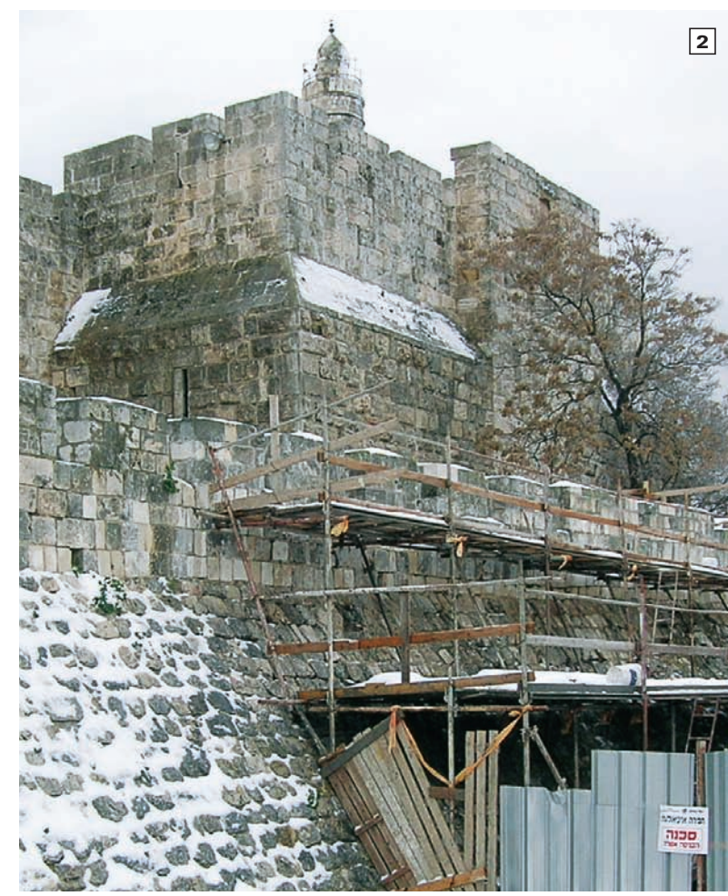
1. מבט לחומות ירושלים העות'מאניות היושבות על שרידי חומות קדומות. 2. עבודות השימור על חומת המצודה.