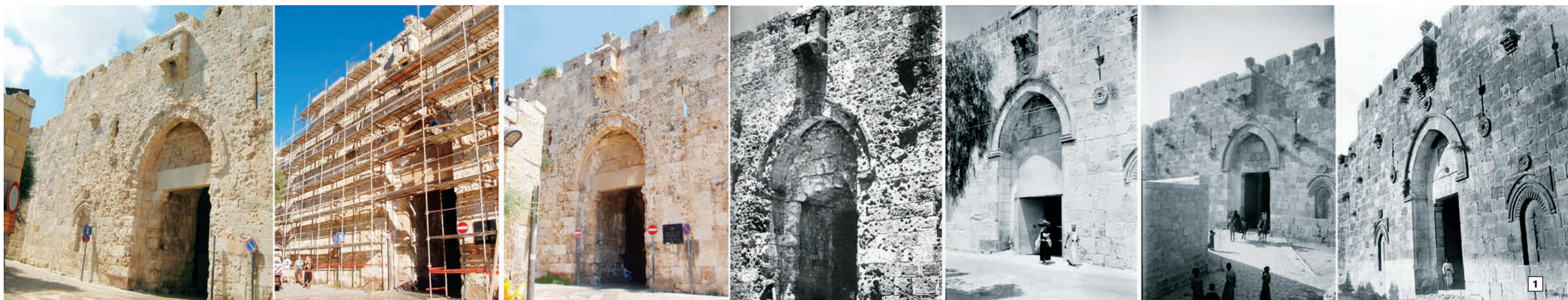
1. המחשת השניונים שעברו על חזית שער ציון ב-150 השנים האחרונות. תאריכי התמונות באיור 1 מימין לשמאל: 1860, 1904, 1936, 1967, 2007 - לפני תחילת העבודות, נובמבר 2007 - במהלך עבודות השימור והשיקום, 2008 - לאחר סיום העבודה. 2-3. הכתובת בשער ציון - לפני ואחרי שימורה.