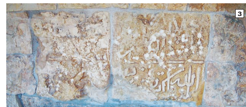
המקורי של החומה על ידי השבת המצב לקדמותו.

מאז הוקמו על ידי הסולטאן סולימאן עברו על החומות שינויים רבים, המשקפים את פני ההיסטוריה ומשפיעים על חזותה של החומה. לחלק מן השינויים יש ערך סיפורי התורם לערכה האדריכלי המקורי של החומה. כל התערבות בשימור החומה מוסיפה פן חדש ועשויה לטשטש הקשרים היסטוריים המשתקפים בה. רבים משינויים אלה התרחשו בשלהי המאה ה-20, עת הפך האזור לזירת קרבות פעילה. באזורים שנפגעו מצאנו את עצמנו ניצבים בפני דילמה מורכבת: הנצחת מאורעות בעלי ערך לאומי על ידי שימור הפגיעות בחומה, מול שימור ערכה האדריכלי