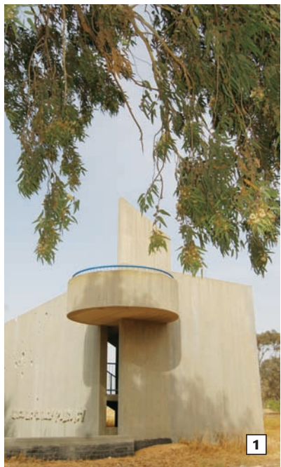
1. מבנה הנצחה שנבנה על חורבות דגור - נירים.

בהמשך, לאחר כחמישה ק"מ (ליד נ"ג 150), יפנו אותנו שלטים למקום פריחת איריס הנגב. פריחת האיריסים בראשית האביב הפכה כבר למסורת של עליות לרגל, אז גם הגלבוץ כורע תחת אלפי המבקרים הנוהרים לראות את איריס הגלבוץ. יש בארץ כמה סוגי איריסים, וכולם יפים. כאן, ליד דרך השדות, פורח בעונתו (בעיקר בפברואר-מרס) איריס הנגב, הנמצא לרוב במערב הנגב. צבעו סגול כהה, והוא בולט יפה על רקע נופי הנגב. במרחבים משני עברי הדרך נראים עצי שיטה נותני צל, אשלים, איקליפטוסים ועצים אחרים. מימין לדרך נראה פרדס שחומת ברושים חוצצת בינו לבין הדרך, וביניהם נטועים שיחי קקטוס.