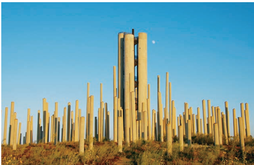
אנדרטת הפלדה שהועברה לכאן מאזור ימית.

עונה: כל השנה. הנופים משתנים ועמם הצבעים וגם ההתרשמות. יש המבכרים לראות את המקום בקיץ, אך הרוב נוטים לחורף. אז ירוק יותר, יש יותר בעלי כנף ובכלל... מפה: מפת טיולים וסימון שבילים מספר 13.