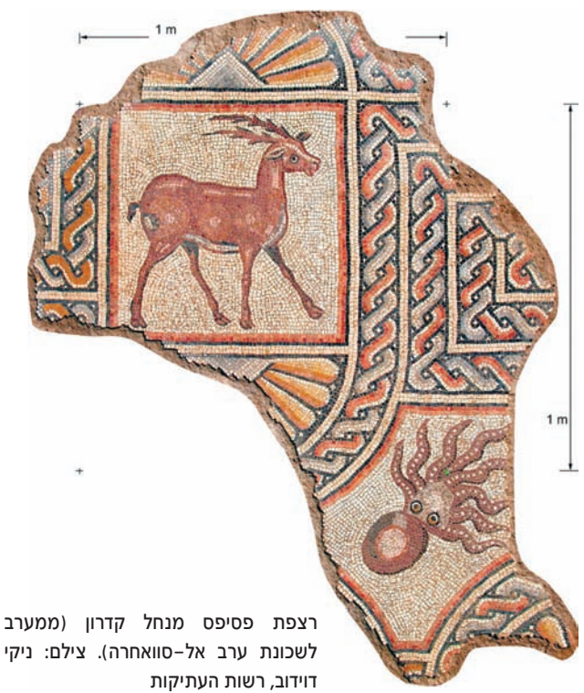
רצפת פסיפס מנחל קדרון (ממערב לשכונת ערב אל-סוואהרה).

משקלה של האבן שבתצוגה כחמש טונות. כמו כן בתצוגה כתובות הקדשה עתיקות בלטינית, ביוונית, בגאורגית ובערבית; פריטים ארכיטקטוניים מגוונים, כרכובים מעוטרים במוטיבים צמחיים מסוגננים, תווי סתתים חקוקים באבן, עמודי מרפק מגולפים ופסיפסים מרשימים, דוגמת הפסיפס מנחל קדרון, שהשתייך לרצפת אולם הכניסה במנזר גדול, ועשוי באיכות מעולה. הקטע ששרד במרכז האולם היה מעין שטיח שעליו פזורים מדליונים תחומים בעיטור חבל ובמוטיבים