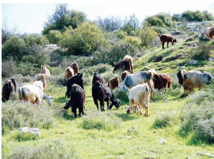
גם עזים מוואדי פוכין נהנות מהירוק ואולי גם מהנוף.

ומישור החוף. מתחתינו רואים את דרך הפטרולים הישנה, זו המסומנת בשחור והעוברת פחות או יותר על קו פרשת המים שבין נחל סנסן ונחל עציונה הנשפכים שניהם לנחל אלה. דרך זו יוצאת מחלקו המזרחי של היישוב צור הדסה (שם היא חסומה) ויורדת עד ליד מושב אביעזר ורוגלית במערב. לאחר כמה עשרות מטרים נפגוש בדרך הפטרולים המסומנת בשחור (9435). כאן עומדות בפנינו שתי אפשרויות שונות. הראשונה היא, להמשיך בדרך השחורה מצפון להר סנסן, לעקוף פסגה נוספת המתנשאת משמאל לנו לרום