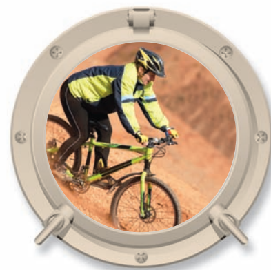
התמונות להמחשה בלבד