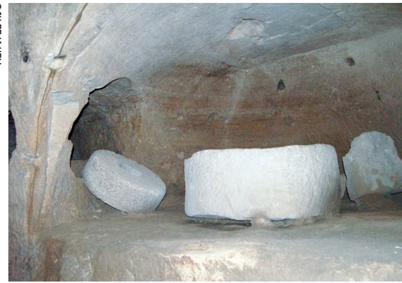
פינה בבית הבר.

שמעון. הבאים מדרום יבואו בכביש החדש שמספרו 358 עד לצומת שליד אמציה, ומשם כמתואר לעיל.