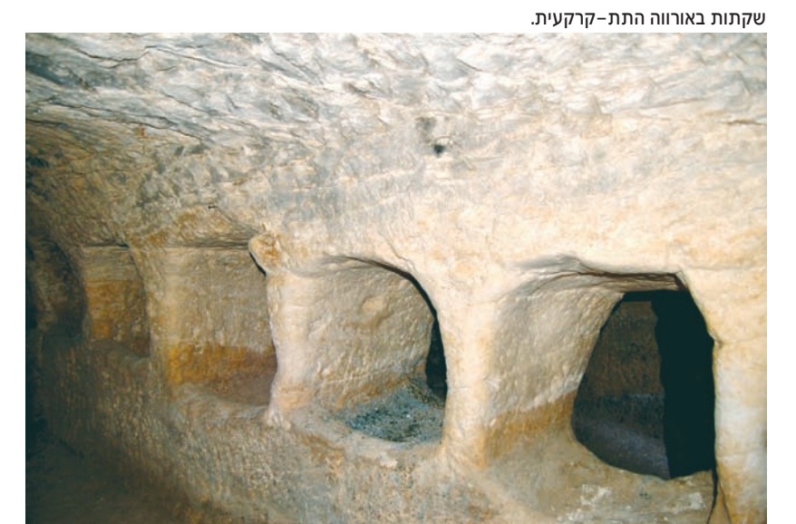
שקתות באורווה התת-קרקעית.

האותיות המודגשות בטקסט מסמנות את הוראות הדרך.