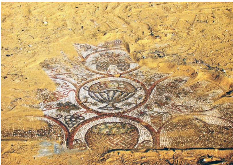
קטע מרצפת הפסיפס.

אפשר לנסוע בשוליו הדרומיים של האתר, לגלוש מעט מערבה עם הדרך עד רחבת חניה קטנה, ומשם כמה מטרים לשטח הכנסייה שנחפרה ורצפת הפסיפס שנחשפה שם. ליד הכנסייה ובשרידיה היו מפוזרים שברי מטאטאים, ודומה שנערך כאן קורס לעובדי ניקיון. כדאי להצטייד במטאטא, שכן בביקורנו האחרון לא מצאנו אותם ועמם נעלם גם מטאטא חדש שהשארנו במקום... רצפת הפסיפס מכוסה חול; מנקים אותה בהרגשה שאנחנו מגלים אותה לראשונה. יש בה ציורי בעלי חיים, בהם ציפורים, חלקם ניזוקו או שקולקלו בעבר ותוקנו ביד גסה. ההרס החלקי של הציורים נעשה כנראה במאה השמינית לספירה, כשניטש ויכוח בכנסייה הנוצרית על סגידה לתמונות, אז גם הגיעו לאקונוקלאזם - איסור איקונין וניתוח פסלים ודמויות, ממש כפי שכתוב במקורותינו על האיסור לעשות פסל ומסכה.