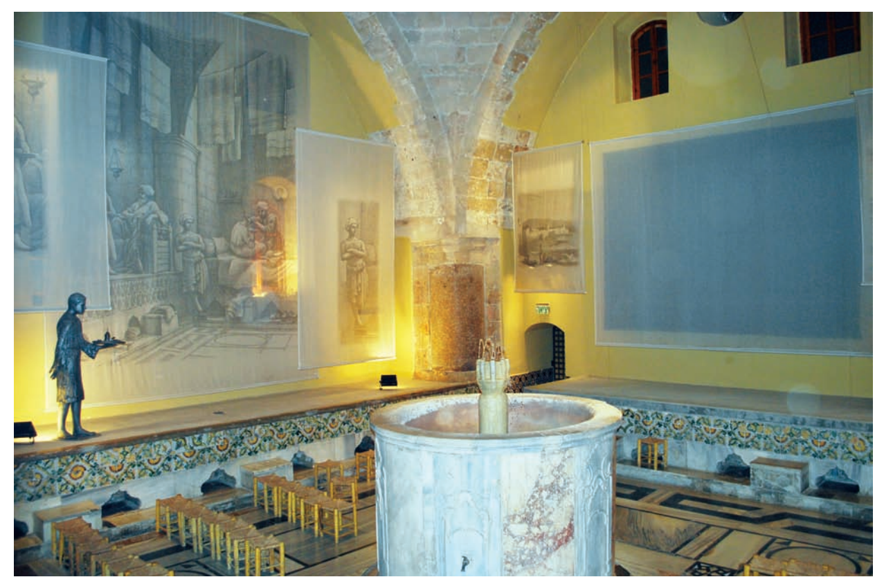
אולם הקבלה של חמאם אל-פאשה.

החמאמים של עכו בעכו ידועים שלושה חמאמים ציבוריים: חמאם אל-שעבי הוא הקדום במרחצאות העיר. הוא נבנה בראשית המאה ה-18 ממערב לח'יאן אל-עומדן. זהו חמאם גדול, מפואר, מעוטר באריחי שיש צבעוניים. בבית