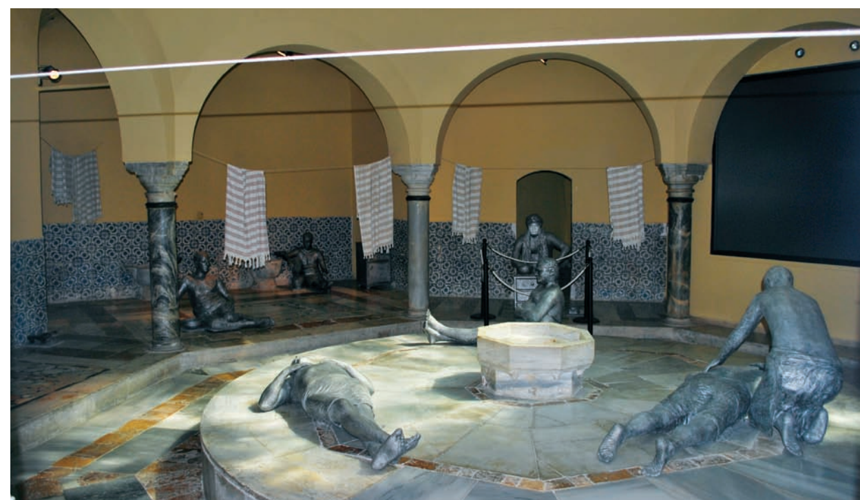
חדר האדים של חמאם אל-פאשה.

בשנת 1785 ביקש אל-ג'אזר, שליט עכו (1775-1804), משלטונות צרפת לשלוח לעיר מהנדסי מים מומחים כדי לתכנן אמת מים שתוליך את מי מעיינות כברי לעכו. עד אז היו מקורות המים לעיר מעיינות אל-בקר ואל-סיט שממזרח לעיר, ובארות מים שנכרו בתחומה. אולם, אוכלוסיית העיר גדלה, ועכו לא יכלה עוד להסתפק במקורות אלו. לאחר שנבנתה האמה נהנתה עכו מהמים הטובים בגליל. מצב זה נשמר עד ראשית שנות ה-60 של המאה ה-20, עת חוברת עכו ל"מקורות" ונתקה ממעיינות כברי. שרידי אמת המים הנראים היום בין כברי לעכו שייכים לאמה שנבנתה ביזמת סולימאן, שליט עכו בשנת 1815 בקירוב. אמה זו חודשה לאחר שאמת המים של אל-ג'אזר נהרסה בימי מצור נפוליאון בשנת 1799.