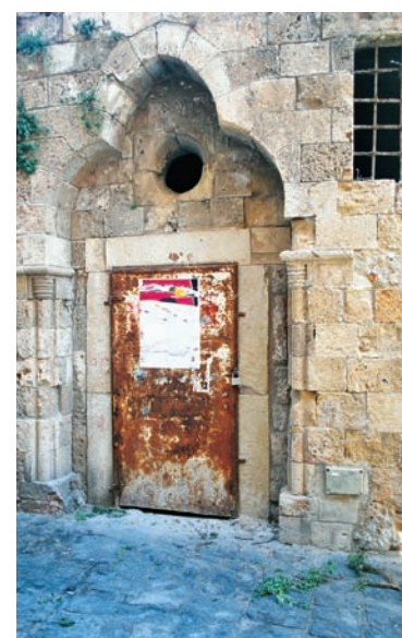
שער הכניסה של חמאם אל-שעבי.